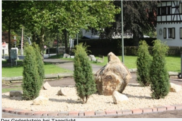
Der Gedenkstein bei Tageslicht.