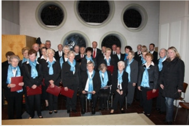
Der Kirchenchor Heilig Kreuz auf der Orgelbühne.