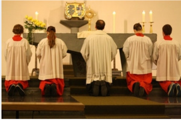
Feierliche Vesper am Abend

Psalmen- und Antwortgesänge tragen zur Feierlichkeit bei. Nach dem Segen erklingt aus vollen Kehlen "Ein Haus voll Glorie schauet weit über alle Land, aus ewgem Stein erbauet von Gottes Meisterhand. Gott wir loben dich, Gott, wir preisen dich. O laß im Hause dein uns all geborgen sein."