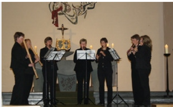
Das Flötenensemble "Da Capo".

"Panis angelicus" - G. P. da Palestrina "Miserere" - P. Janczak "Ich bete an die Macht der Liebe" - D. Bortnjanskij