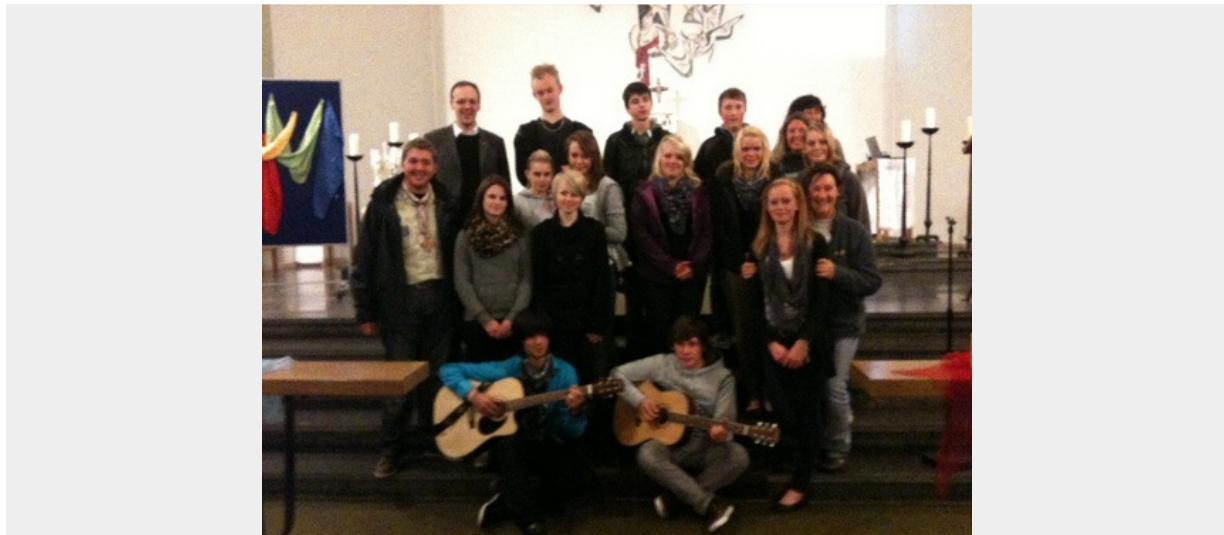
Das Vorbereitungsteam mit dem Jugendchor "Sky Spirit".