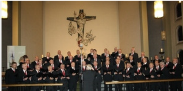
Der Belecker Männerchor "Pankrätius 1860".

"Ave Maria" - P. L. Ph. Dietsch "Dein Wort, Herr, bleibet ewig" - Max Reger "Preiset froh den König" - H. Purcell