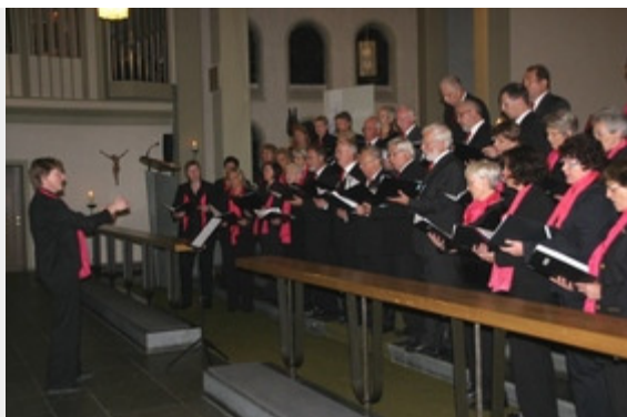
Der Gemischte Chor Belecke.